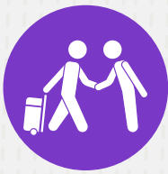
IMAGEN DEL ANFITRIÓN

Tu imagen es una carta de presentación que debe reflejar confianza y profesionalismo . Debes ser aseado y ordenado con tu persona.